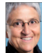
von Silva Semadeni, Nationalrätin

68 400 Unterschriften hat der Gewerbeverband gegen die ausgewogene Revision des Raumplanungsgesetzes eingereicht. Wir werden im Frühjahr also an der Urne entscheiden. Eine breite Koalition stellt sich gegen das Referendum und ist fest entschlossen, dem Vollzugsdefizit in der Raumplanung endlich verbindliche Regelungen entgegenzustellen. Verbindliche Regelungen braucht es auch für die Umsetzung der Zweitwohnungsinitiative. Die SP verlangt zudem die Verschärfung der Lex Koller. Die Hürde für spekulative Immobilienkäufe durch Personen im Ausland muss höher werden.