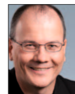
von Max Chopard-Acklin, Nationalrat

Der schonende Umgang mit den Ressourcen muss nicht im Widerspruch zur Wirtschaft stehen. Das wird einem beim Besuch der neu erbauten Umwelt-Arena in Spreitenbach schnell klar. Es beginnt schon bei der Aussenhülle: Das futuristisch anmutende Gebäude mit der momentan grössten dachintegrierten Solaranlage der Schweiz liefert viel Strom: Die 5300 Quadratmeter grosse Fotovoltaikanlage produziert 540 000 Kilowattstunden im Jahr (entspricht dem Verbrauch von 120 Haushalten) und