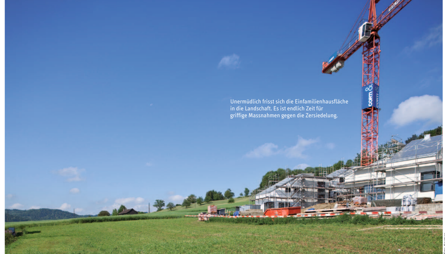
Unermüdet frisst sich die Einfamilienhausfläche in die Landschaft. Es ist endlich Zeit für griffige Massnahmen gegen die Zersiedelung.

Im nächsten Frühling kommt die Revision des Raumplanungsgesetzes vors Volk. Die Revision bringt verbindliche Regelungen und ist deshalb anzunehmen. Ebenso sind verbindliche Regelungen für die Umsetzung der Zweitwohnungsinitiative gefordert.