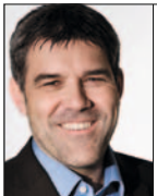
von Eric Nussbaumer, Nationalrat

Der günstigste und sauberste Strom ist der nicht benötigte. Die eidgenössische Stromeffizienz-Initiative will den Schweizer Stromverbrauch auf dem Niveau von 2011 stabilisieren. Unterstützen Sie dieses Vorhaben: Unterschreiben Sie dieses Unterschriftenbogen und senden Sie ihn noch heute ab. Vielen Dank.