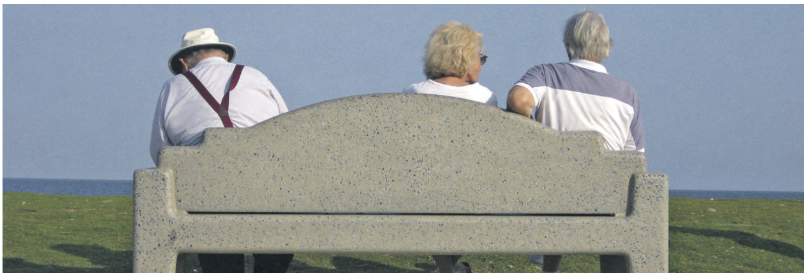
L'initiative AVSplus renforce l'assurance sociale la plus solidaire de notre pays.