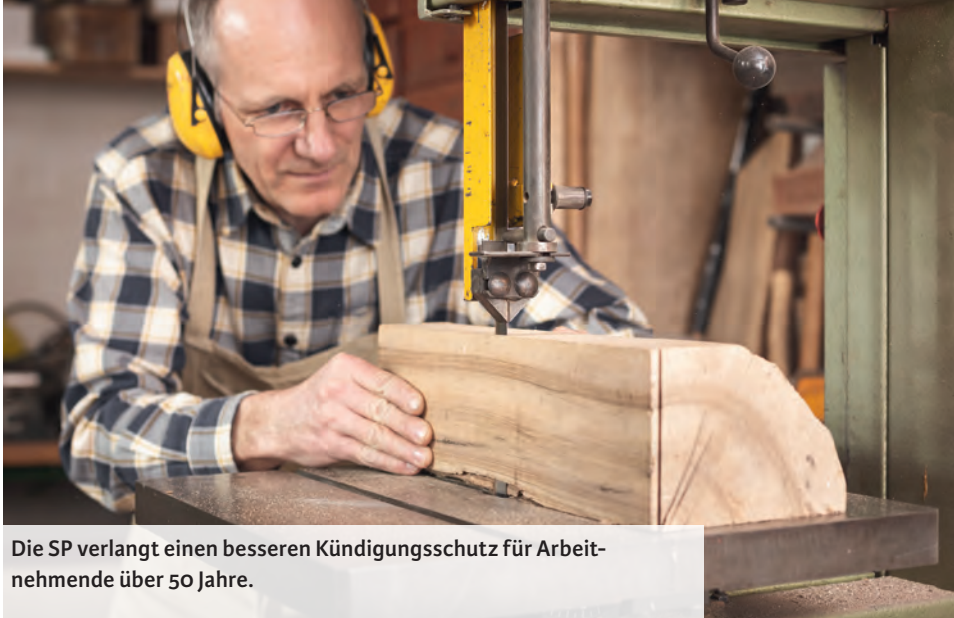
Die SP verlangt einen besseren Kündigungsschutz für Arbeitnehmende über 50 Jahre.