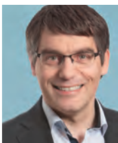
Roger Nordmann, Nationalrat (VD)

Erstens hat die Mehrheit von FDP und SVP mit knappen Mehrheiten (zwischen einer und drei Stimmen) das CO 2 -Gesetz vollständig verwässert. Auch wenn die beiden Parteien in den darauffolgenden kantonalen Wahlen abgestraft wurden, haben sie damit doch einen Etappensieg für die Öl-Lobby sowie für die Interessen der Luftfahrt erzielt, gegen die dringend nötige Einschränkung des Verbrauchs fossiler Energien.