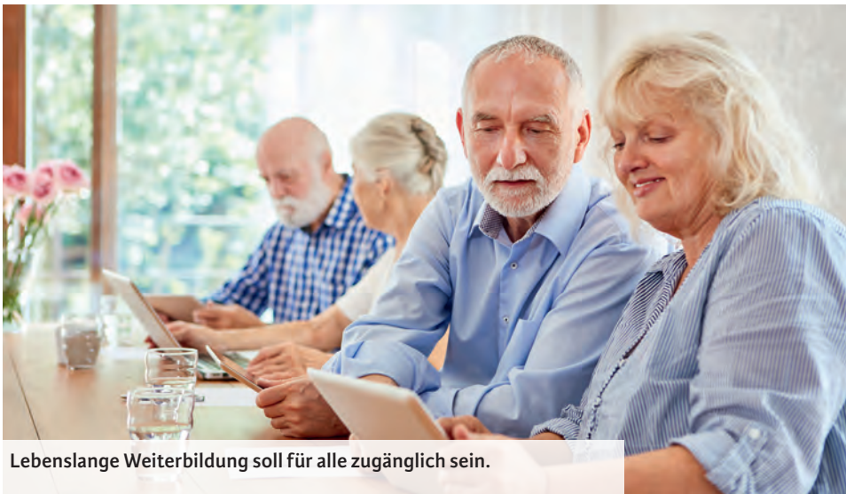
Lebenslange Weiterbildung soll für alle zugänglich sein.