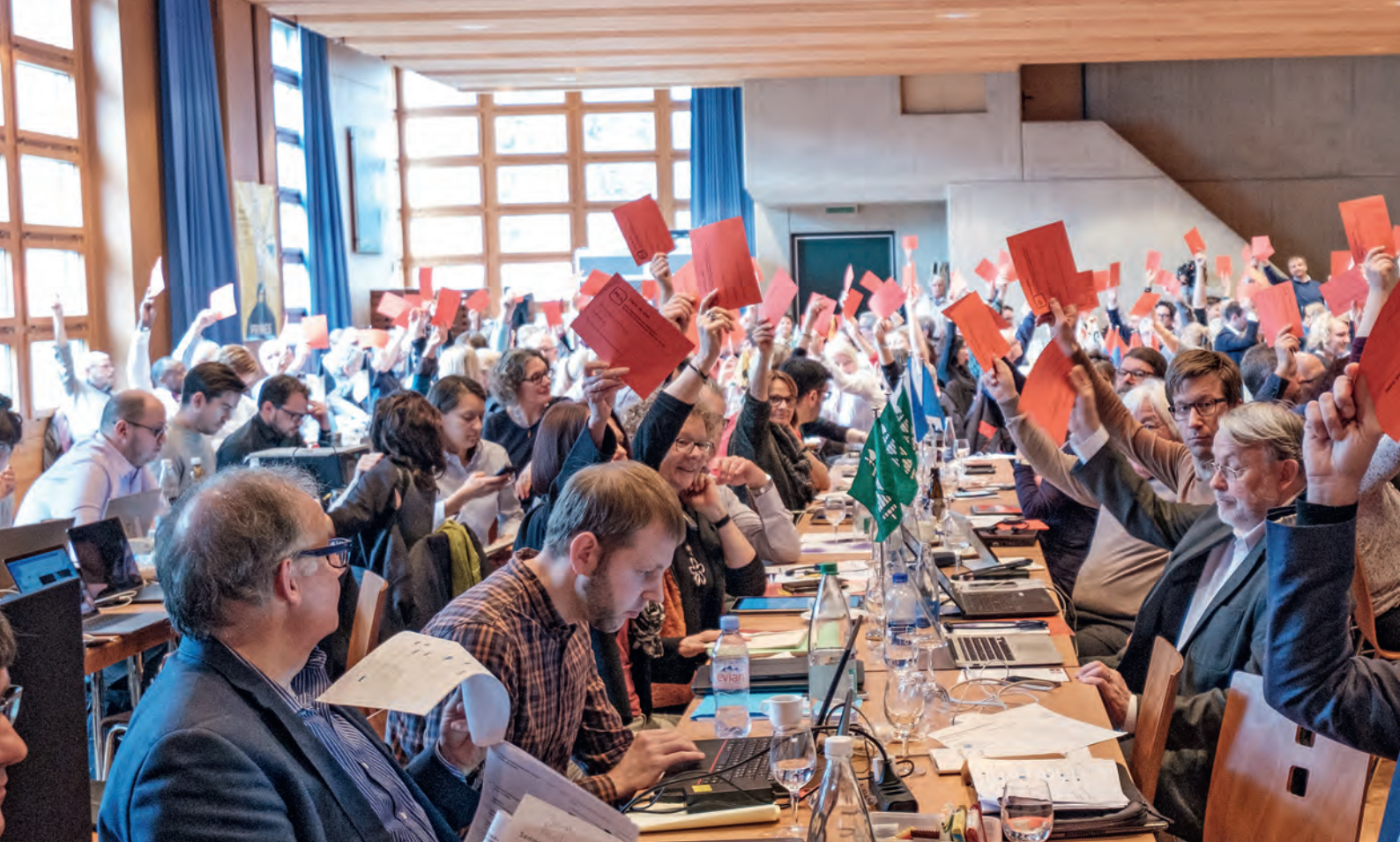
Die SP Schweiz verabschiedete das Positionspapier «Arbeit und Ausbildung für alle» an der Delegiertenversammlung im März 2019.

EINES DER VIER WAHLKAMPFTHEMEN DER SP FÜR KOMMENDEN HERBST IST «ARBEIT UND AUSBILDUNG FÜR ALLE». Damit ist gemeint, dass alle Menschen das Recht auf eine zweite Chance auf dem Arbeitsmarkt haben sollen. Wenn man von Arbeit spricht, muss man auch von Arbeitslosigkeit sprechen. Jedes Jahr klopfen sich die Zuständigen bei Bund und Kantonen auf die Schulter. Doch sie verkennen die Realität, die sich hinter den vor- geblich tiefen Arbeitslosenzahlen verbirgt. Kantone und Gemeinden sind jeden Tag mit den Bezügerinnen und Bezüger von Sozialhilfe konfrontiert, mit der Situation von Arbeitnehmenden auf einem zunehmend prekären Arbeitsmarkt.