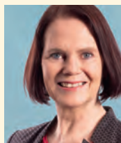
Claudia Friedl, Nationalrätin (SG)

Die Klimaerhitzung schreitet voran. Seit 1995 waren alle Jahre wärmer als im Schnitt der Periode von 1960 bis 1990. Weltweit ist die Durchschnittstemperatur um über 1°C gestiegen, in der Schweiz sogar überdurchschnittlich um 2°C. Es ist unübersehbar: Die Gletscher verlieren Jahr für Jahr einen Meter Dicke. Zyklone werden Jahr für Jahr stärker, weil die Meere wärmer werden.