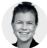
Nadine Masshardt, Nationalrätin BE

Der Autobahnausbau steht im Widerspruch zum Klimaziel der Schweiz. Die Stimmbevölkerung hat im Juni 2023 das Klimaschutzgesetz deutlich angenommen. Die Vorlage sieht vor, dass die Schweiz bis 2050 klimaneutral werden muss. Um dies zu erreichen, muss der öffentliche