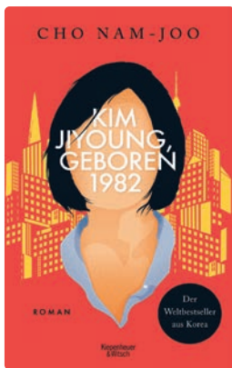
Geboren 1982, von Cho Nam-joo

Klappentext: Die Mitdreissigerin Kim Jiyoung hat kürzlich ihren Job aufgegeben, um sich um ihr Baby zu kümmern, wie es von koreanischen Frauen erwartet wird. Doch schon bald zeigt sie seltsame Symptome: Ihre Persönlichkeit scheint sich aufzuspalten, denn sie schlüpft in die Rollen anderer Frauen. Als sich die Psycho verschlimmert, schickt sie ihr Ehemann zu einem Psychiater. Nüchtern zeichnet dieser ihr Leben nach, das bestimmt ist von Frustration und Unterwerfung. Dabei wird ihr Alltag stets von männlichen Figuren überwacht – von Primarschullehrern, Arbeitskollegen oder auch vom Vater. Und in den Augen ihres Mannes ist es ihre Pflicht, die Karriere aufzugeben, um sich um ihn und das Kind zu kümmern.