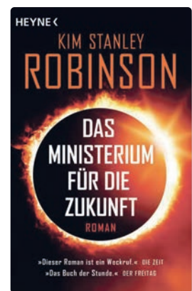
Das Ministerium für die Zukunft, von Kim Stanley Robinson

Klappentext: Indien, 2025. Das Land wird von einer gnadenlosen Hitzewelle heimgesucht, die Temperaturen erreichen mancherorts über 50 Grad. Hunderttausende Menschen sterben, es werden ganze Stadtviertel ausgelöscht. Zu den Überlebenden gehört der Entwicklungshelfer Frank May. Schwer traumatisiert zieht er in die Schweiz, um mit jenen abzurechnen, die seiner Meinung nach mitverantwortlich sind: Das Ministerium für die Zukunft, dessen Aufgabe es eigentlich ist, solche Katastrophen zu verhindern. In Mary Murphy, der Vorsitzenden des Ministeriums, findet Frank unerwartet eine Verbündete, die wie er gegen den Klimawandel kämpft, wenn auch mit anderen Mitteln.