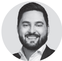
Mattea Meyer und Cédric Wermuth, Co-Präsidenten SP Schweiz

Die SP hat national beim Wähler:innenanteil um 1,5 % zugelegt und fast 1000 Mitglieder gewonnen. Das ist ein riesiger Erfolg, den wir nur dank der tatkräftigen Mithilfe von euch allen erreichen konnten. Ein riesiges Merci! Trotzdem schauen wir mit Sorge in die Zukunft, denn der Rechtsrutsch wird uns zu schaffen machen.