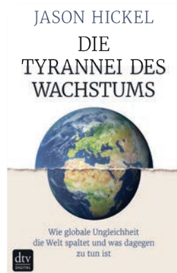
Die Tyrannei des Wachstums, von Jason Hickel

Klappentext: Seit Jahrzehnten hören wir: Entwicklung hilft, die südlichen Länder der Welt schliessen zum reichen Norden auf, die Armut hat sich in den vergangenen 30 Jahren halbiert, bis zum Jahr 2030 ist sie verschwunden. Das ist eine tröstliche Geschichte, die von Politik und Wirtschaft gerne bestätigt wird. Aber sie ist nicht wahr. In Wirklichkeit hat sich die Einkommenslücke zwischen Nord und Süd seit 1960 verdreifacht, 60 Prozent der Weltbevölkerung verdienen weniger als 4,20 Euro am Tag. Armut ist kein Naturphänomen, sie wird gemacht.