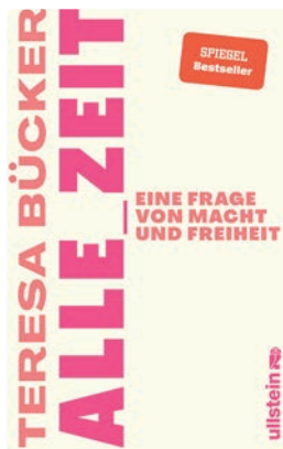
Alle_Zeit, von Teresa Bücker

Klappentext: Zeit ist die zentrale Ressource unserer Gesellschaft. Doch sie steht nicht allen gleichermaßen zur Verfügung. Teresa Bücker, eine der einflussreichsten Journalistinnen in Deutschland, macht konkrete Vorschläge, wie eine neue Zeitkultur aussehen kann, die für mehr Gerechtigkeit, Lebensqualität und gesellschaftlichen Zusammenhalt sorgt.