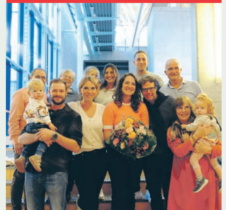
Familie Schläfli nach Ninas Wahl