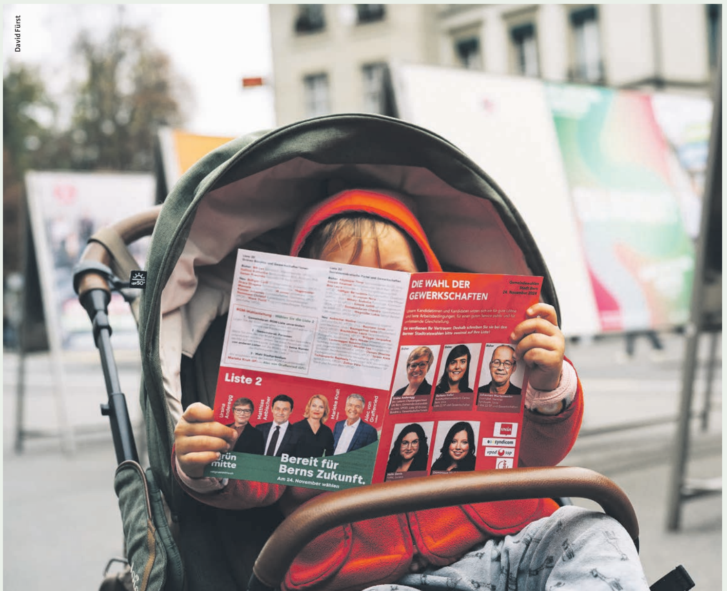
Eindrücke aus dem Strassen-Wahlkampf: Auch die Kleinsten sind von unseren Positionen überzeugt!

Mit diesem historischen Wahlerfolg im Rücken ist die SP in der Stadt Bern bestens aufgestellt, die Herausforderungen der kommenden Jahre zu meistern. Gemeinsam mit der Berner Bevölkerung werden wir daran arbeiten, Bern zu einer noch gerechteren, lebenswerteren Stadt zu machen.