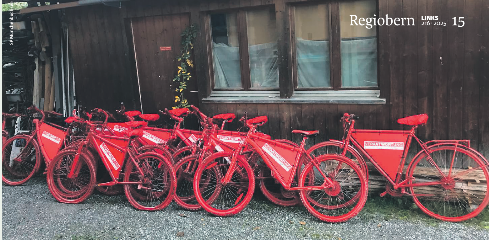
Die rot gesprayten SP-Wahlkampf-Velos in Münchenbuchsee, wahre Hingucker im Wahlkampf.